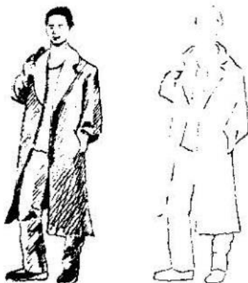
Abbildung 1.2 Zwei Personen in unterschiedlicher Ausarbeitung

Wenn Sie zwei gleiche Motive gleich groß auf einem Blatt Papier zeichnen und dabei das eine Motiv detaillierter darstellen und das andere nur vage in den Umrissformen zeichnen, erscheint uns das detaillierte Motiv näher zu sein als das nur angedeutete Motiv.