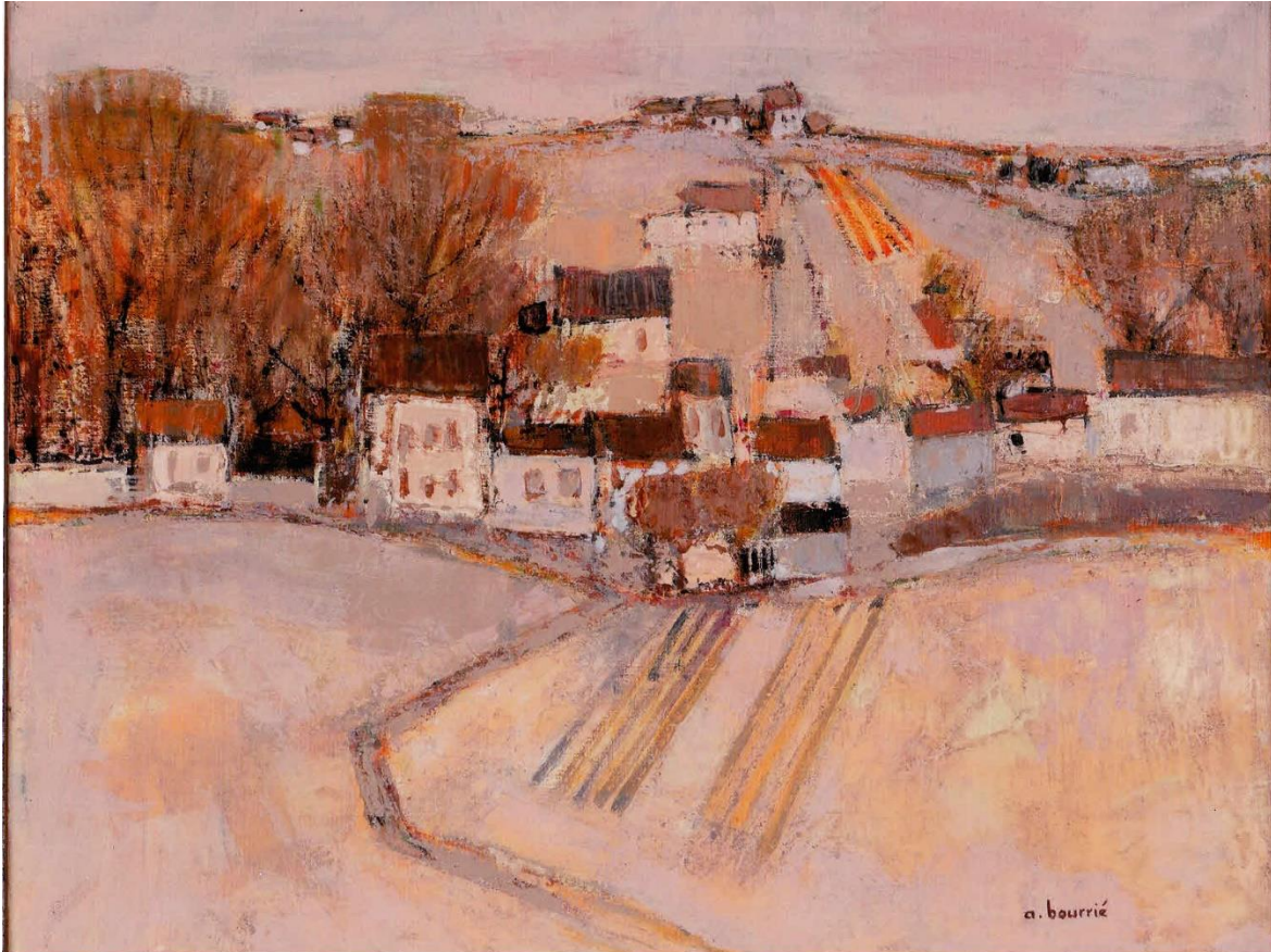
Bild 2, Fantasy in Acryl

Die Bildkomposition ist gelungen. Der Hauptteil, die Ufos oder Raumschiffe sind zentral angesiedelt. Die Steine im Vordergrund sind farblich gut gestaltet ebenso der Farbkontrast zu den blau-grünen Steinen. Auch die Bäume im Vordergrund sind mit warmen und kalten grün sowie mit gelb farblich gut gestaltet. Die dunklen Bäume im Hintergrund setzen sich nicht nur durch ihre Farbe, sondern auch durch die Überlagerung der Bäume im Vordergrund gut nach hinten ab. Die warmen Farben der Fluggeräte drängen in den Vordergrund. Siehe Farbenlehre, im Abschnitt c. Da Vorder- und Mittelgrund sehr detailliert ausgearbeitet wurden bringt ein einfarbiger Himmel wieder etwas Ruhe in das Bild.